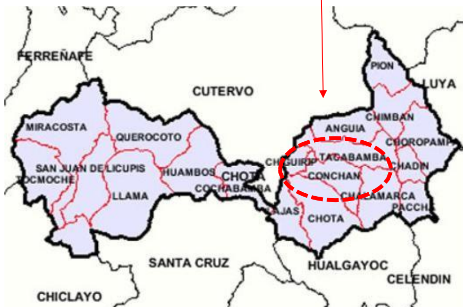
Imagen N° 03: Mapa de ubicación distrital Conchán