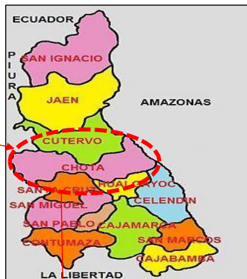
Imagen N° 02: Mapa de ubicación provincial de Chota.