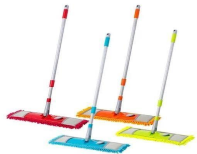
TRAPEADOR DE MICROFIBRA CON MANGO RECUBIERTO DE PVC