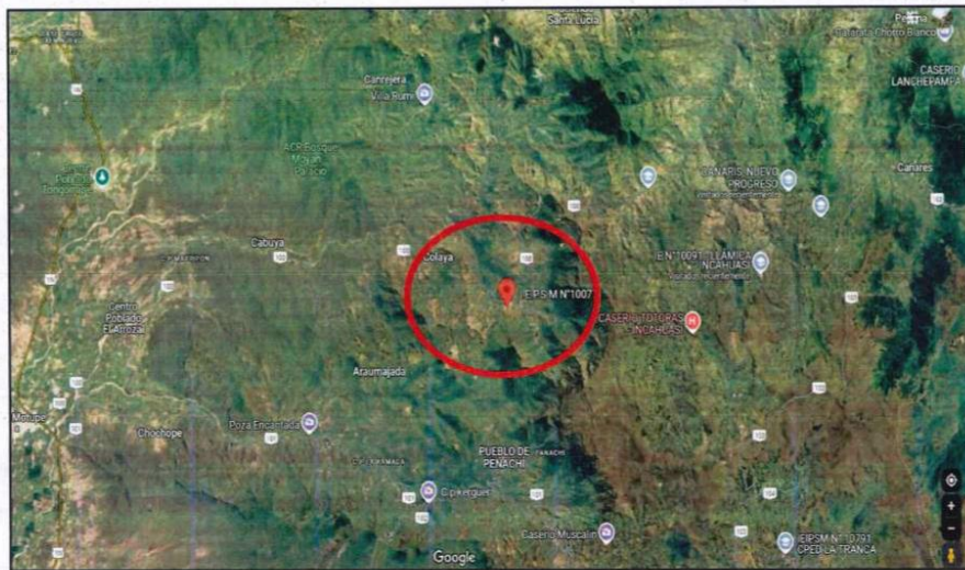
Cuadro 12: Ubicación de la I.E. (Maps)