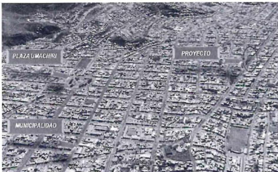
IMAGEN DE UBICACION