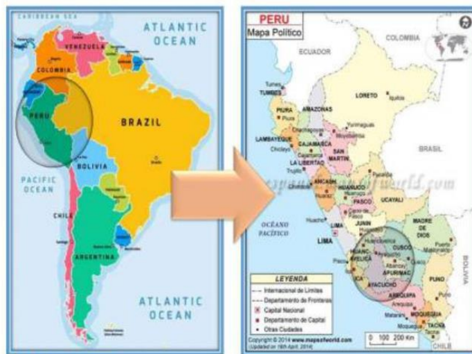
IMAGEN N°01 UBICACIÓN DEL MANTENIMIENTO PERIÓDICO. FIGURA N° 01 - MAPA DE UBICACIÓN MACRO