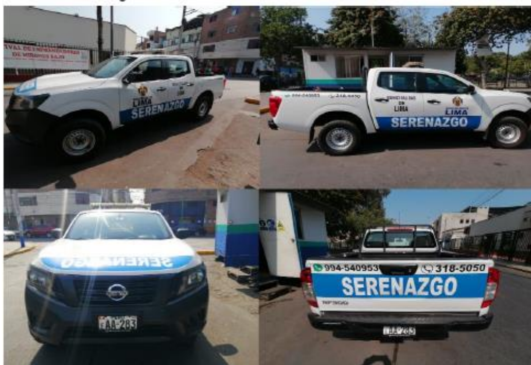
Imagen referencial de PINTADO Y/O PLOTEADO

ultravioletas para las puerta laterales seguida del texto "MUNICIPALIDAD DE LIMA", debajo el texto "SERENAZGO" asimismo el texto "SERENAZGO" en el capot del vehículo rotulado en material DG3. Lo cual puede ser pintado y/o ploteado según Anexo B 16 .