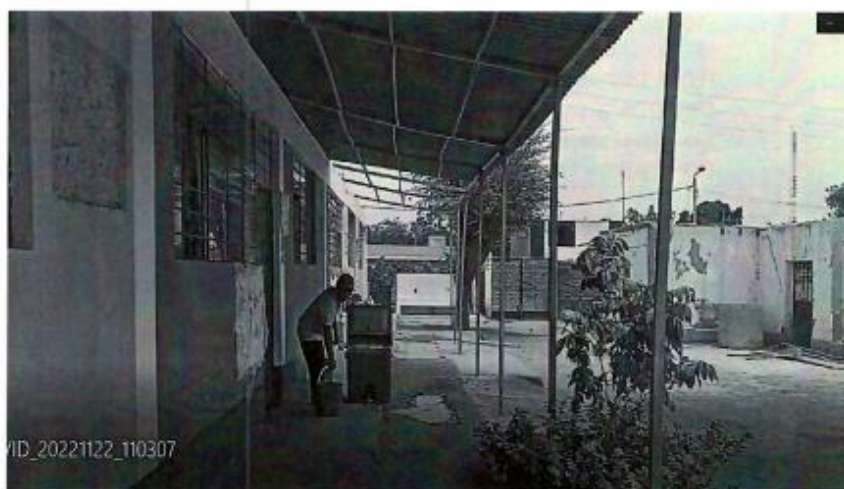
Aulas antiguas, con que se cuenta, terreno a construir.

"Año De La Unidad, La Paz Y El Desarrollo"