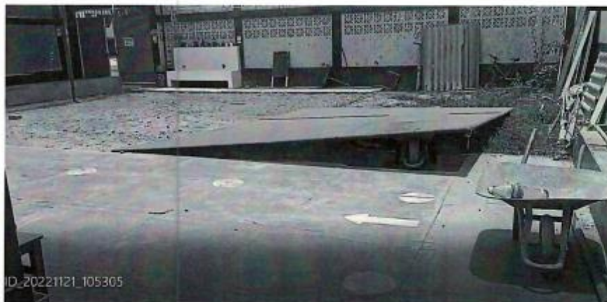
.- Area de terreno a construir.