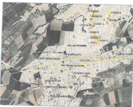
Imagen satelital.