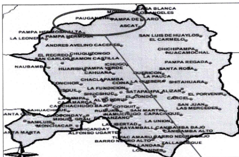
Caseríos Pauganche - Ascat

El proyecto contempla las siguientes partidas: