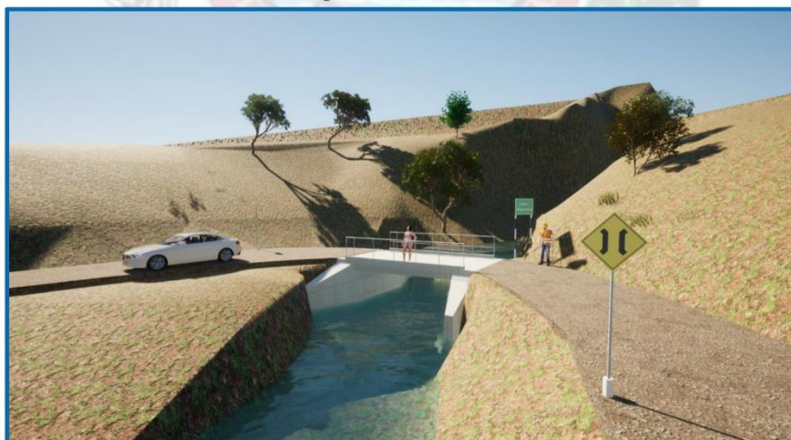
Figura N° 10: Vista 3D del puente.