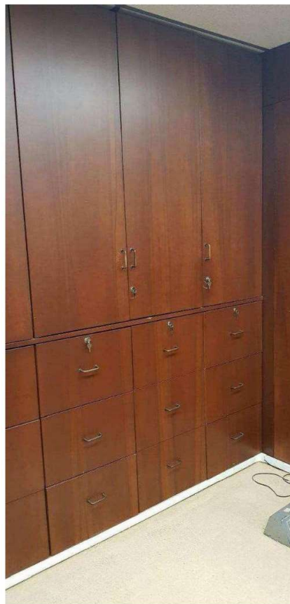
Closets Altos empotrados.

Estos elementos fijos de madera son muebles tipo closets altos empotrados, los cuales en su gran mayoría forman parte del alineamiento con los tabiques altos de madera, fueron fabricados con aglomerado MDP de 18mm, enchapado por ambas caras con láminas de enchape cedro, carapacho o ishpingo, consta de puertas batientes superiores e inferiores, o puertas superiores y cajones inferiores (closet especial), las puertas son batientes con bisagras cangrejo y los cajones corredizos con correderas telescópicas con sistema de trampas y chapa de seguridad, jaladores de acero, cromado o bronce.