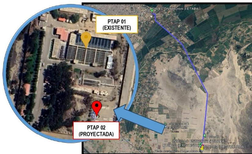
Figura 1 UBICACIÓN PTAP 02 (PROYECTADA).