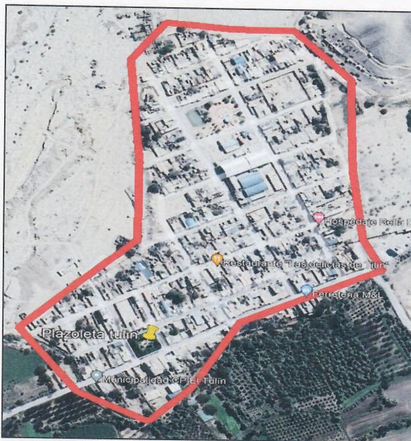
Imagen N°2 - vista satelital del Centro Poblado de Tulin

AV. FCO BOLOGNESI S/N (Frente a la Plaza de Armas) – El Ingenio