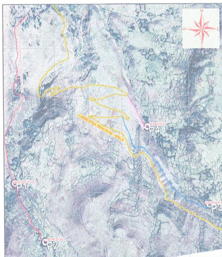
Lugar del proyecto, Google Maps.