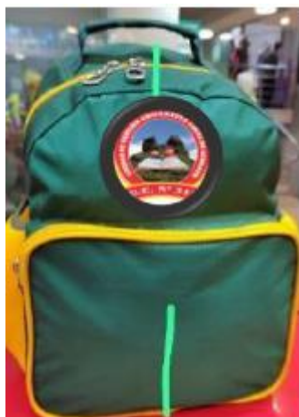
1. MOCHILA INICIAL I CICLO