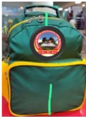
2. MOCHILA INICIAL II CICLO