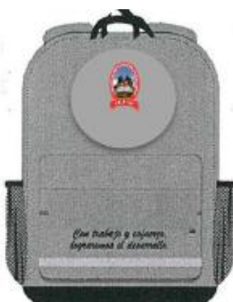
3. MOCHILA PRIMARIA 1°, 2° Y 3°