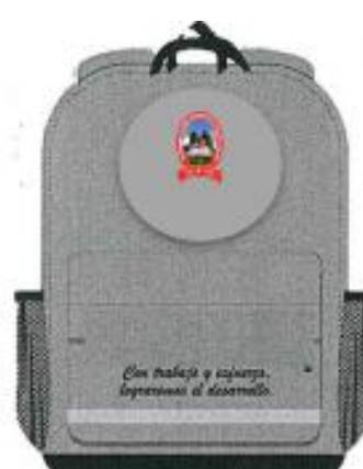
4. MOCHILA PRIMARIA 4°, 5° Y 6°