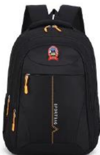
4. MOCHILA SECUNDARIA