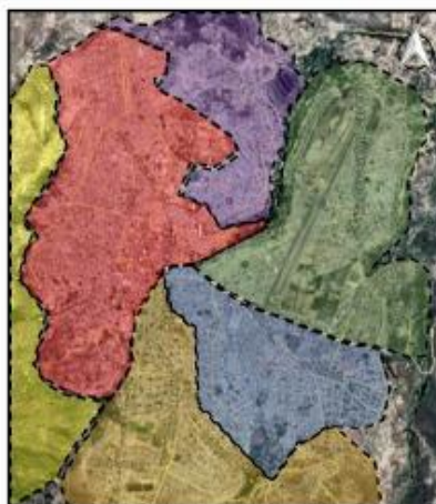
Imagen N°1.- límites de Ayacucho.