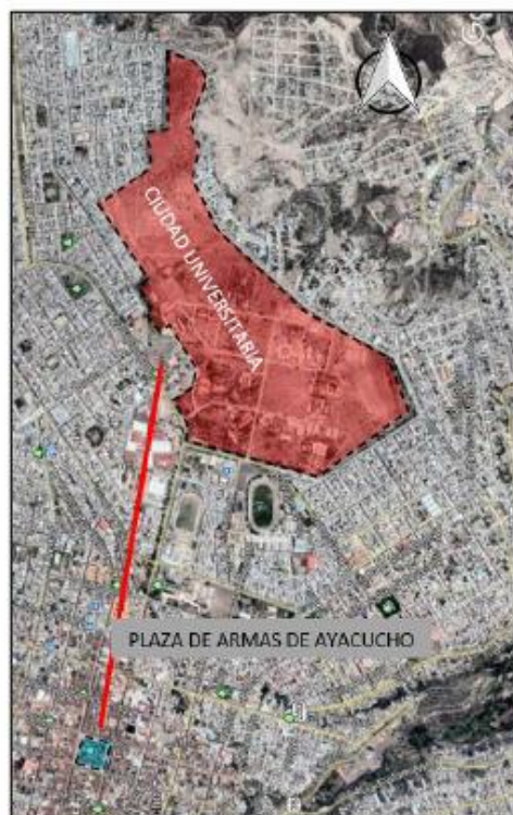
Imagen N°2.- Llegada a la zona de obra.