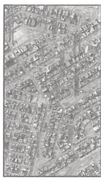
Figura N°11: Ubicación de la I.E. N°160.