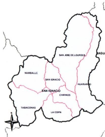
MAPA 01. Ubicación Geográfica: Región Cajamarca y Provincia de San Ignacio y Distrito San Ignacio