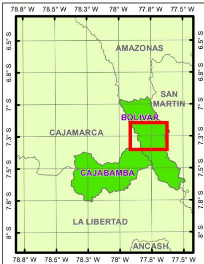
MAPA DE UBICACIÓN DE LA PROVINCIA DE BOLIVAR

"Año del Bicentenario, de la consolidación de nuestra independencia, y de la conmemoración de las heroicas batallas de Junín y Ayacucho"