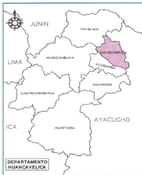
MAPA N° 03: LOCALIZACIÓN DEL PROYECTO