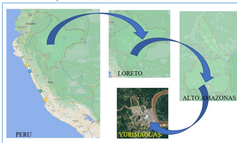
FIGURA.1 Ubicación Geográfica del Proyecto.