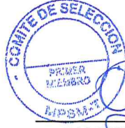
SALOMON GUERRA GUERRA Primer Miembro