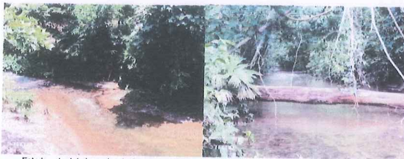
Estado actual de la quebrada San Antonio Bajo

El área de estudio para el presente proyecto, está ubicado en el distrito de Huipoca, a una altitud de 340 msnm, E= 448319.610, N= 9011209.605. La ausencia de protección de las viviendas aledañas a la quebrada San Antonio Bajo, conlleva el peligro de que, en épocas de mayores precipitaciones pluviales, estas se muestren vulnerables al peligro permanente de ser rebasadas por las avenidas máximas del riachuelo, causando malestar en la población y vulnerabilidad de pérdida de infraestructura económica y social.