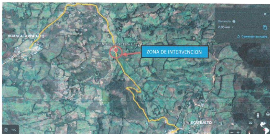
Ubicación de la zona de intervención "Puente Huancacarpa Alto" en la localidad de Huancacarpa Alto, en el camino vecinal PI 834.