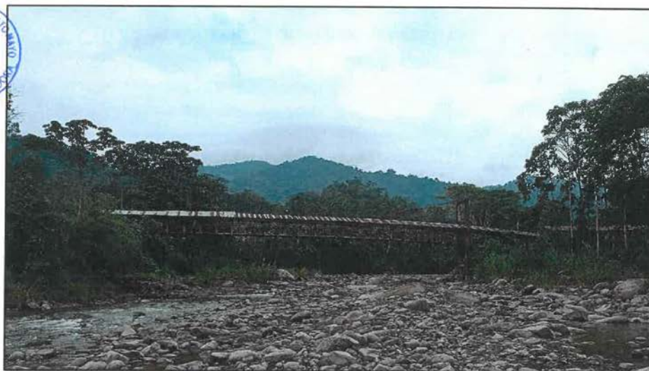
Moyobamba - Perú – 2023