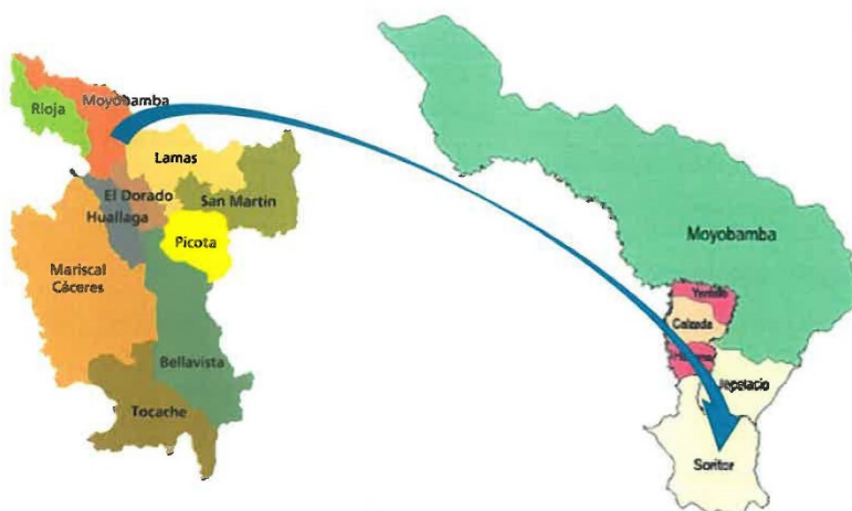
Ilustración 2: Mapa de la Provincia de Moyobamba