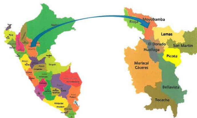
Ilustración 1: Mapa Político del Perú y del Departamento de San Martín