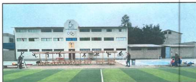
POLIDEPORTIVO DE LA I.E N°22770