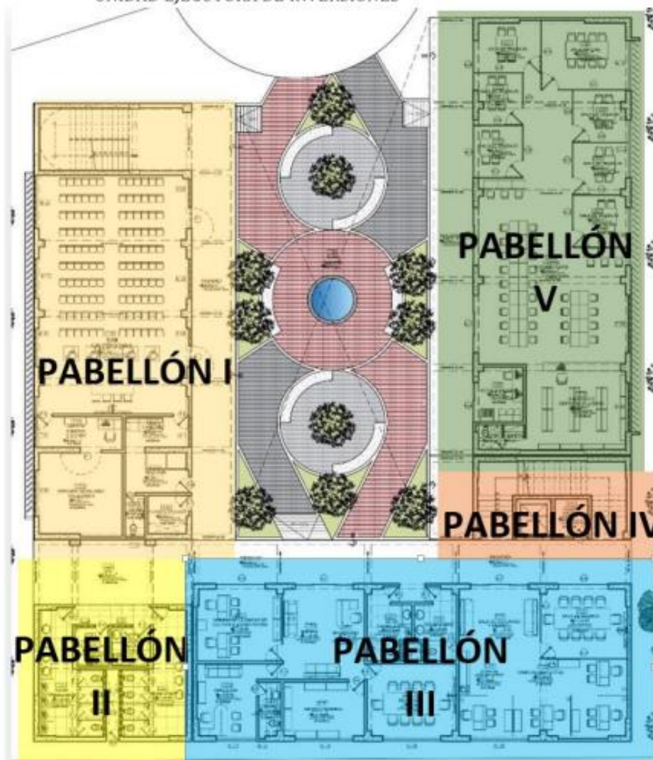
GRÁFICO: MASTER PLAN DE LA PROPUESTA