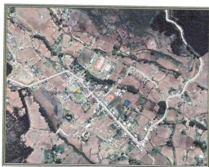
Ubicación del Centro Poblado de Uchubamba.