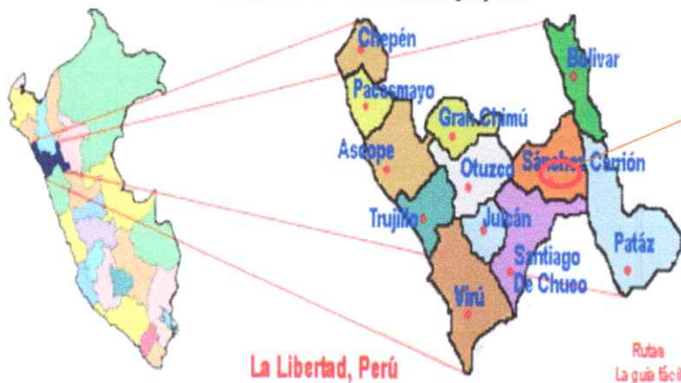
Imagen N° 1. Ubicación del proyecto

Provincia de Sánchez Carrión en la Región La Libertad