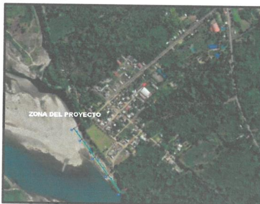
FIGURA: 02. VISTA SATELITAL DEL RIO APURÍMAC SECTOR PUERTO MAYO