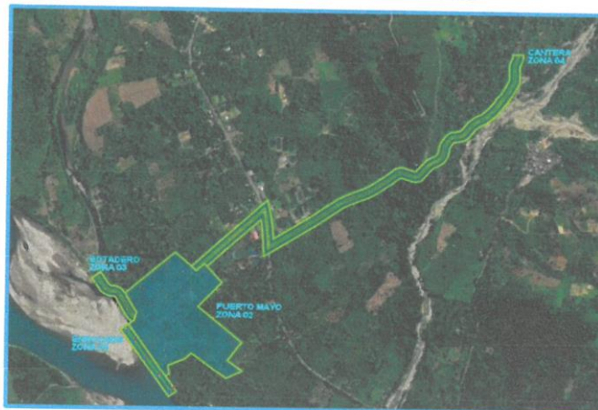
FIGURA: 01. VISTA TERRITORIAL DEL DEPARTAMENTO DEL CUSCO

"AÑO DE LA UNIDAD, LA PAZ Y EL DESARROLLO"