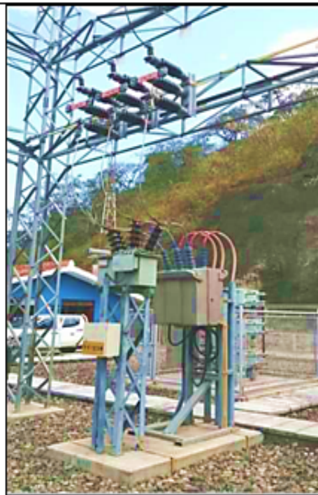
Celda de salida 22,9 kV