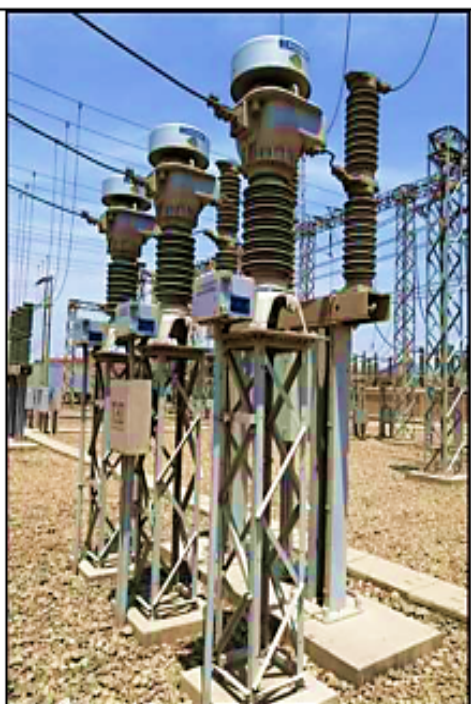
Equipamiento patio 60 kV L-6032