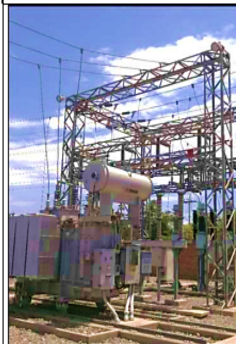
Transformador 60/22,9/10 kV, 5 MVA