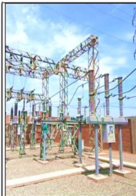
Equipamiento 60 kV