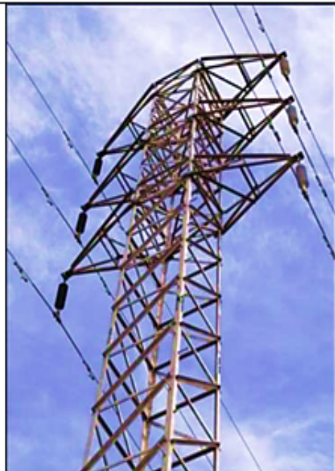
Estructura con aisladores poliméricos