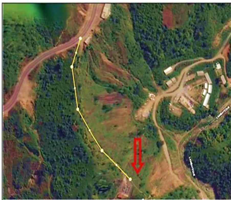
SUBESTACIÓN ELÉCTRICA OCCIDENTE