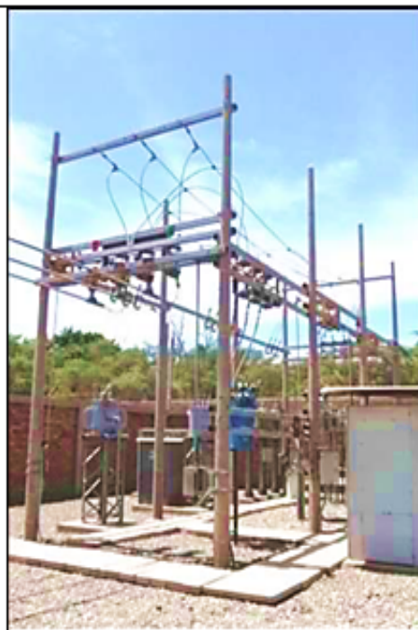
Equipamiento 10 kV