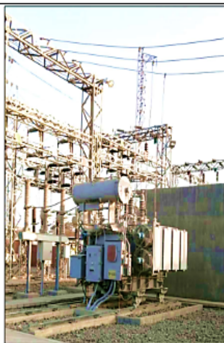
Transformador 60/10 kV, 5 MVA