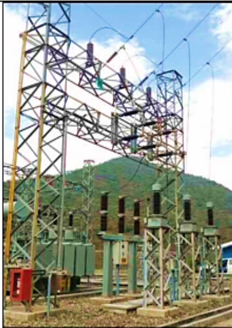
Equipamiento de celda 60 kV