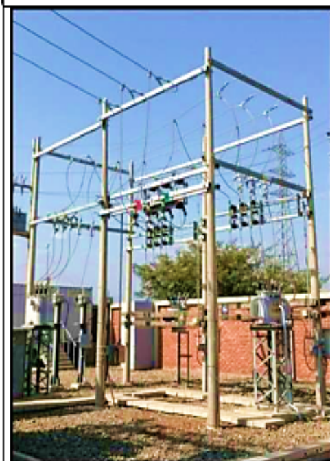
Equipamiento 10 kV