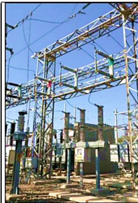
Equipamiento 60 kV