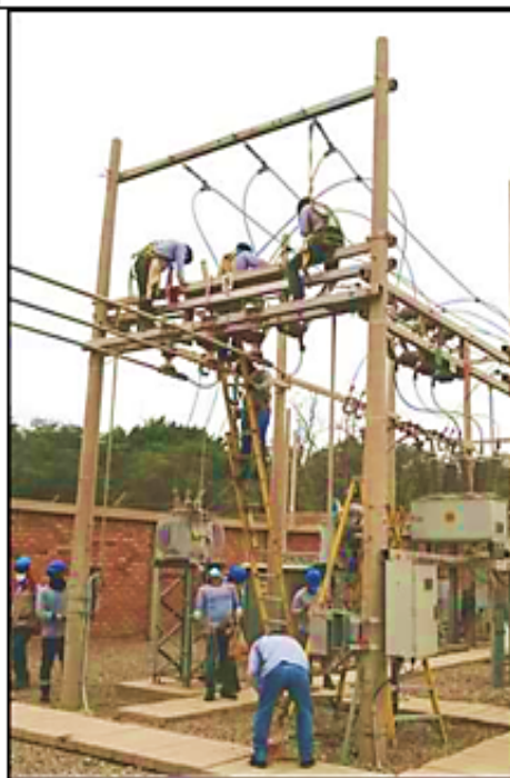
Patio de llaves 10 kV