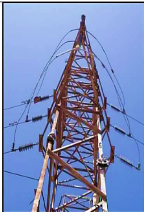
Disposición de aisladores de anclaje