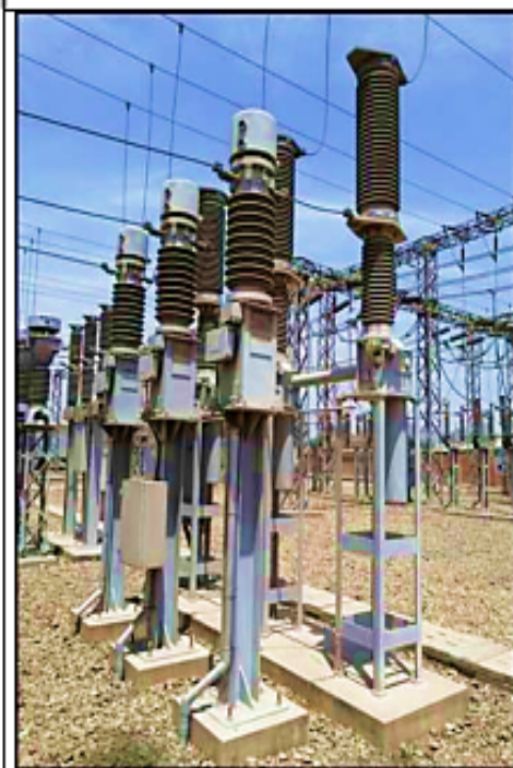
Equipamiento patio 60 kV L-6032