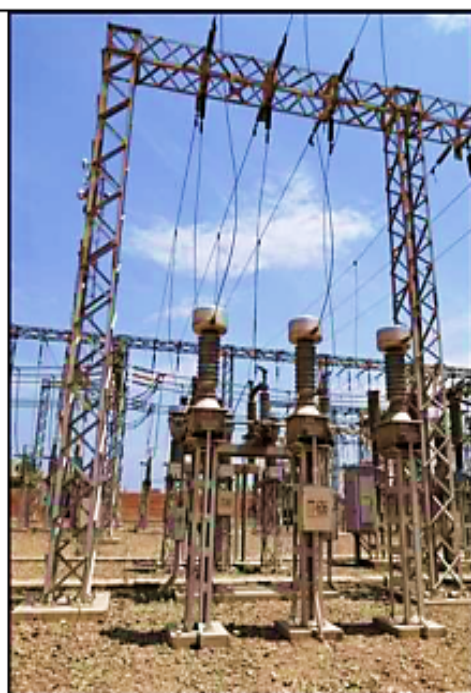
Equipamiento celda 60 kV L-6033