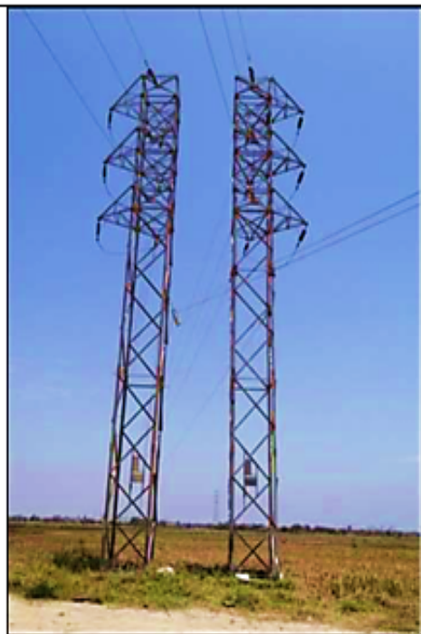
Estructuras de Anclaje