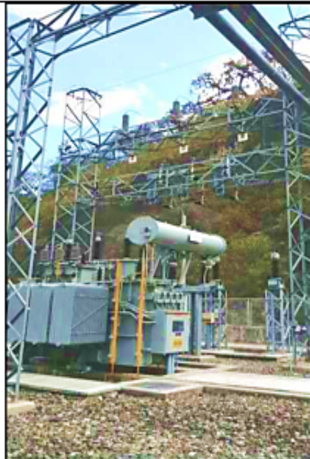
Transformador 60/22,9/10 kV, 7 MVA