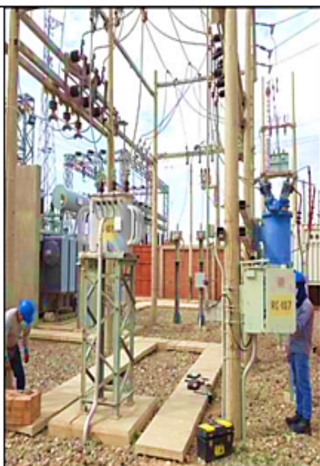
Patio de llaves 10 kV