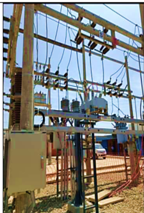
Equipamiento 22,9 y 10 kV