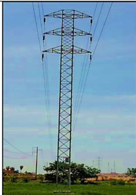
Estructura de suspensión doble tema