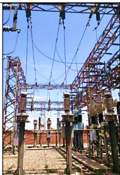
Equipamiento barra 60 kV