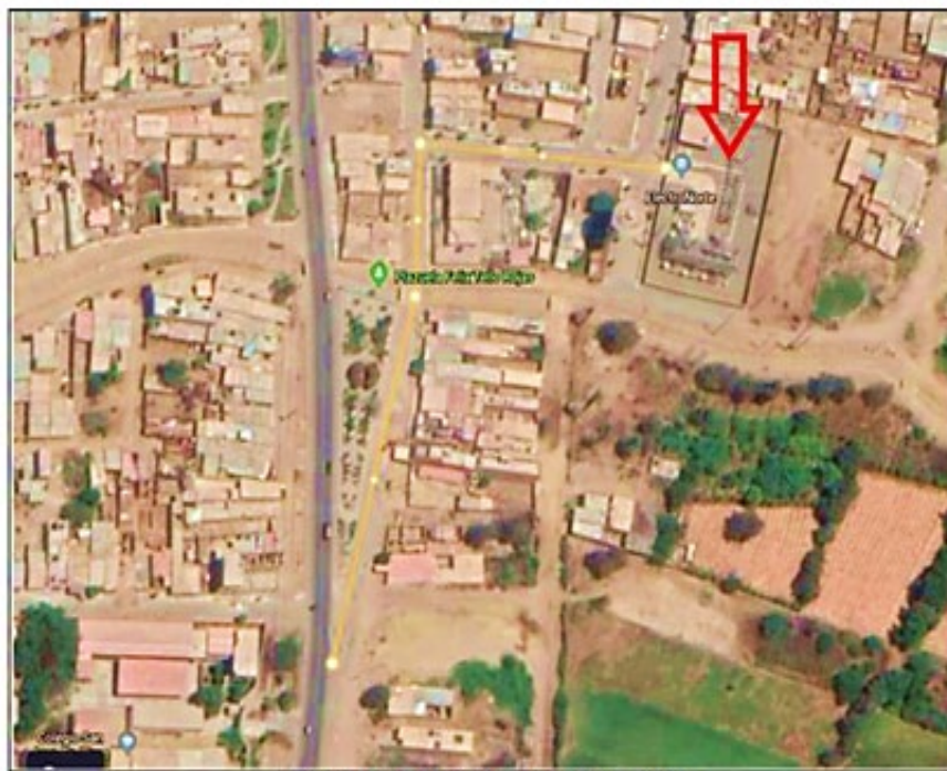
SUBESTACIÓN ELÉCTRICA ILLIMO