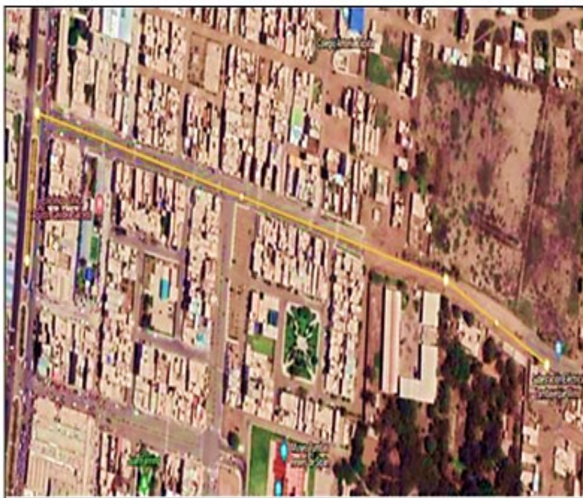
SUBESTACIÓN ELÉCTRICA LAMBAYEQUE

CELDA DE SALIDA 60 KV SUBESTACIÓN CHICLAYO OESTE