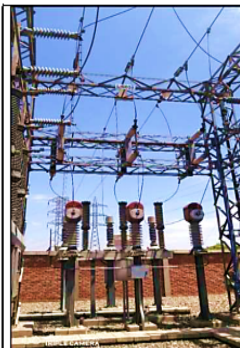
Equipamiento 60 kV (Celda L-6034)