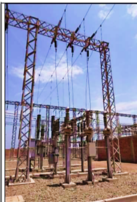
Equipamiento celda 60 kV L-6032