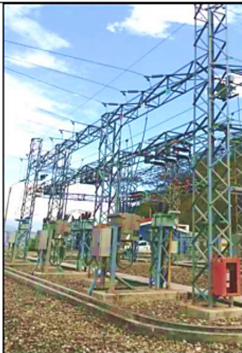
Equipamiento 22,9 kV