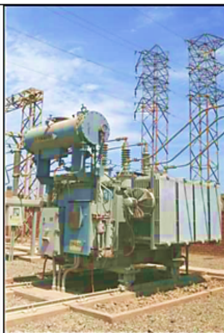
Transformador 60/10 kV, 7 MVA