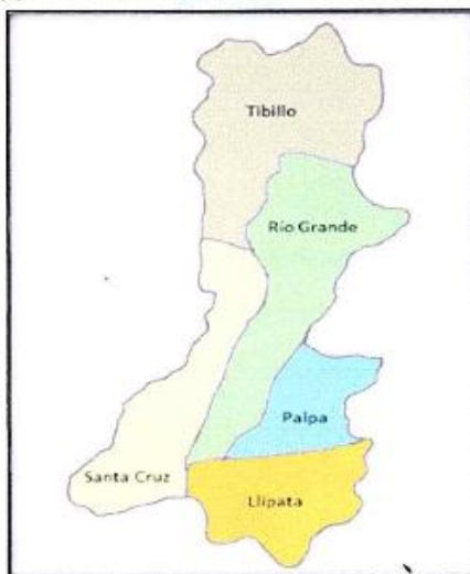
(c) Ubicación Política de la Distrito de Palpa