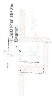
DETALLE ANCLAJE ESC. 1:10