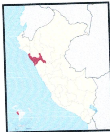
Figura 02: Mapa Departamental del Perú.