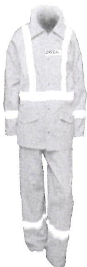
Uniforme de Mantenimiento

"AÑO DE LA RECUPERACIÓN Y CONSOLIDACIÓN DE LA ECONOMÍA PERUANA"