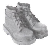
Zapatos de Seguridad con Punta de Acero