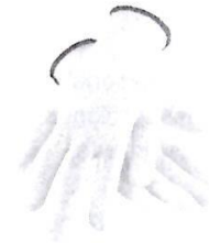
Guantes de Seguridad de Obra