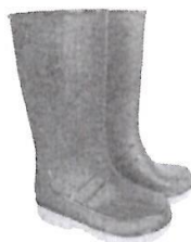
Botas de Jebe