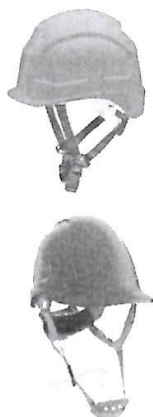
Casco de Seguridad