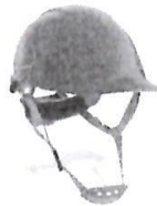
Casco de Seguridad