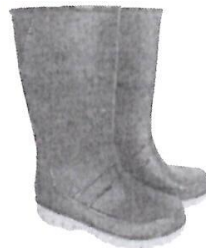
Botas de Jebe