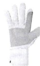
Guantes de Seguridad de Obra