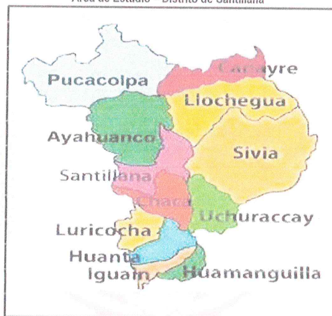
Área de Estudio – Distrito de Santillana

El proyecto se ubicará en la localidad de Santillana, distrito de Santillana, Provincia de Huanta, Región Ayacucho de acuerdo al equipo técnico, se concluye que la localidad se encuentra apta para intervenir. A continuación, se muestra la macro localización del proyecto.