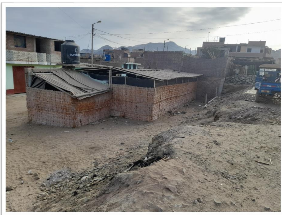
Figura N°7: Se puede ver el desnivel entre el área del proyecto y la calle Las Gardenias