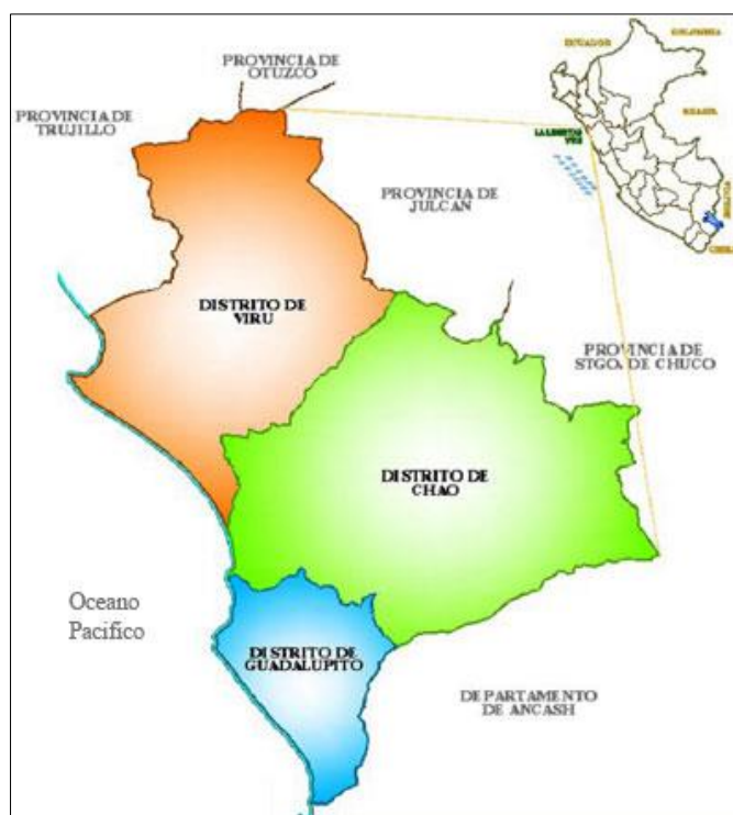
Figura N°02: Ubicación del Distrito de Chao