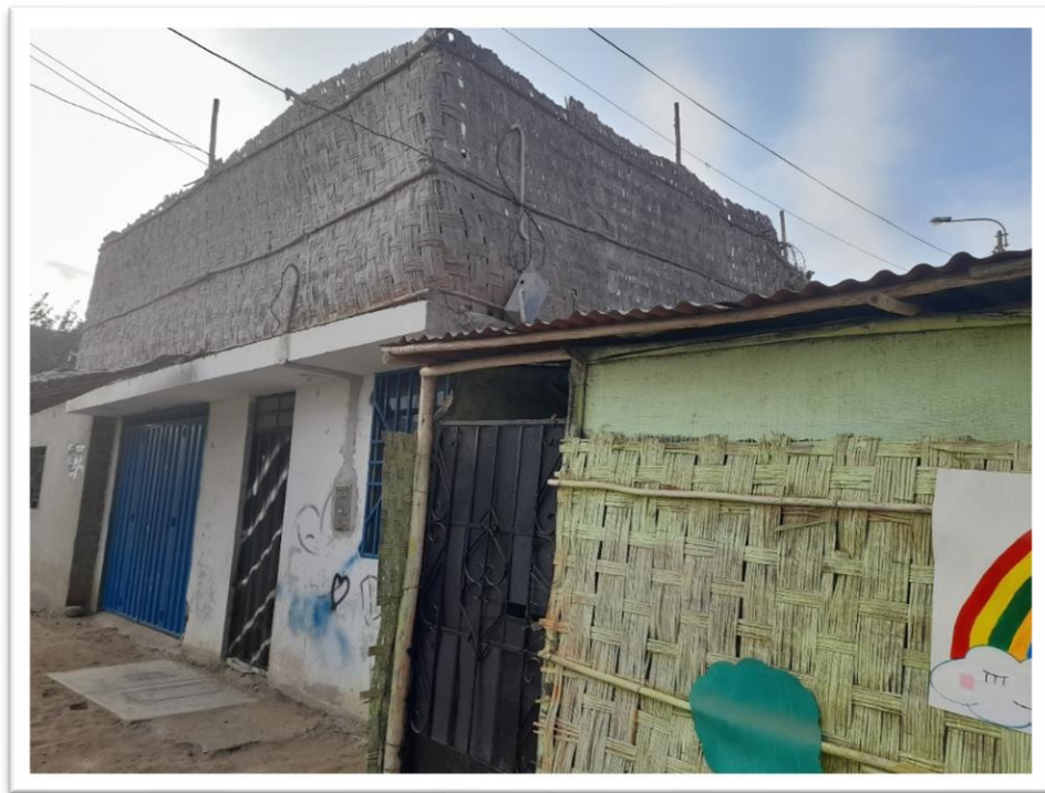
Figura N°5: Situación actual de la I.E Caritas Felices