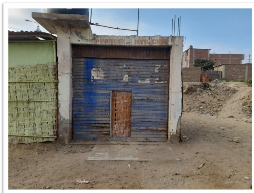
Figura N°6: Situación actual de la estructura de la I.E Caritas Felices