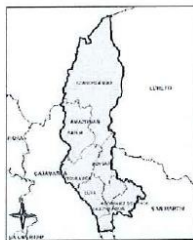
Ilustración 2: Mapa del departamento de Amazonas y sus provincias.