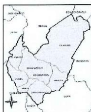
Ilustración 3: Mapa de la provincia de Utcubamba