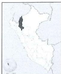
Ilustración 1: Ubicación del departamento de Amazonas en el mapa del Perú