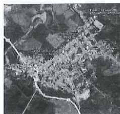
Ilustración 4: Distrito de Cajaruro