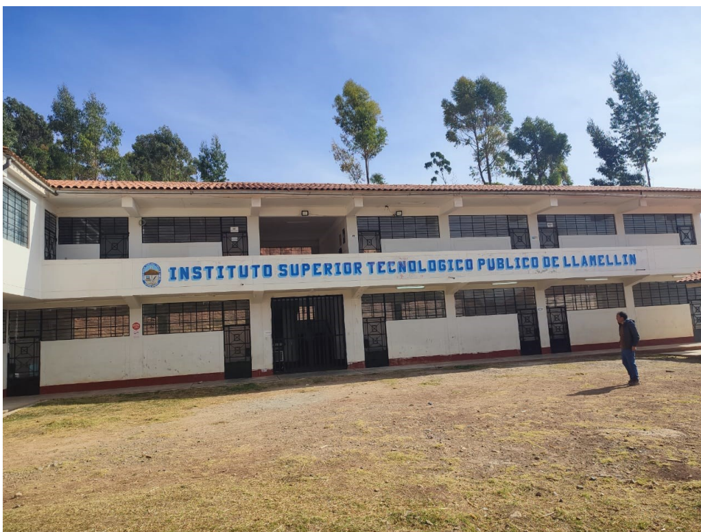
Imagen 04: Se aprecia el Instituto de Educación Superior Tecnológico Público de Llamellín. Se muestra de dos niveles de material noble.

En general, el Instituto Superior Tecnológico Público de Llamellín, se encuentra ubicado en la Localidad de Llamellín, Distrito de Llamellín, Provincia de Antonio Raymondi y Departamento de Ancash, ya tiene 35 años de funcionamiento, la