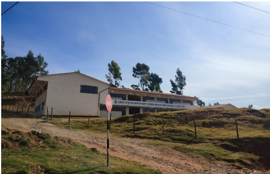
Imagen 01: Se aprecia que dicho Instituto de Educación Superior Tecnológico Público de Llamellín, no cuenta con un cerco perimétrico adecuado, solamente está delimitado con cercas de madera y púas, el cual no es adecuado para una institución pública.