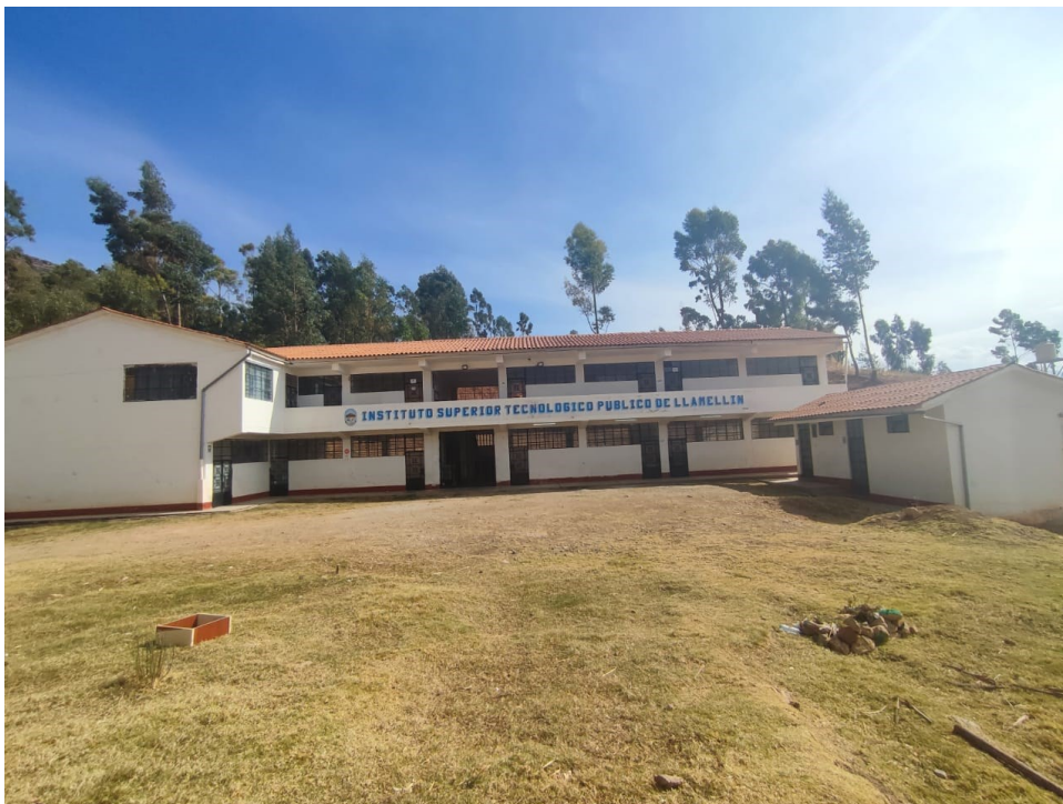
Imagen 03: Se aprecia que el Instituto de Educación Superior Tecnológico Público de Llamellín, cuenta con espacios disponibles para otras infraestructuras tales como. Losa comedor cocinas etc.