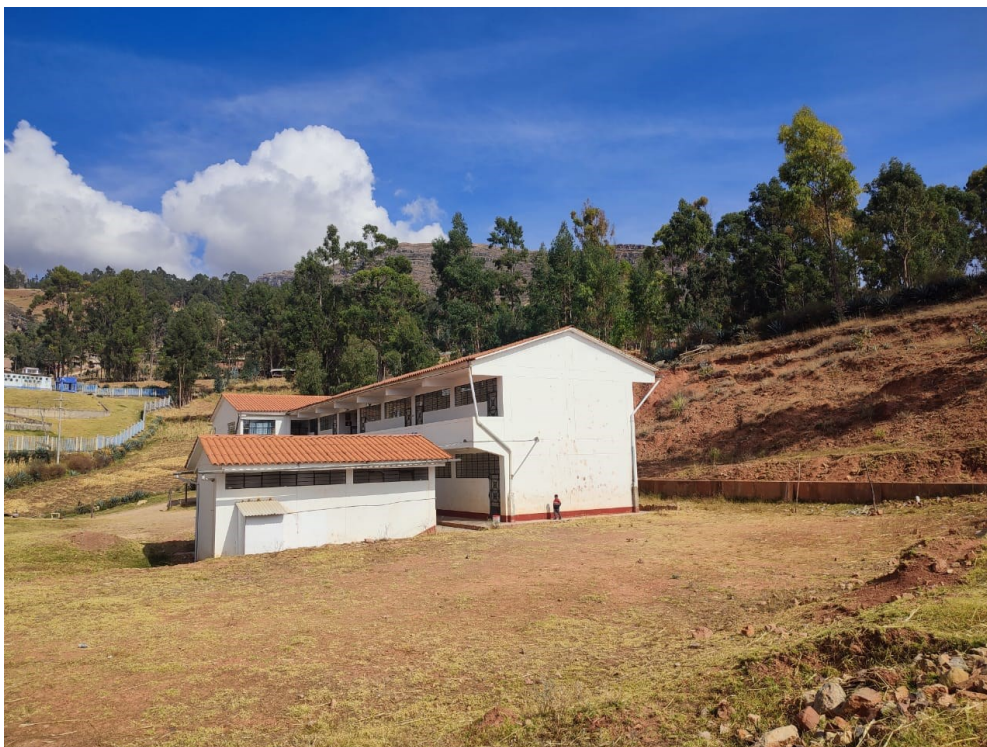
Imagen 02: Se aprecia el Instituto de Educación Superior Tecnológico Público de Llamellín que no cuenta con un cerco perimétrico, además de ello se aprecia que hay espacios para las demás infraestructuras.