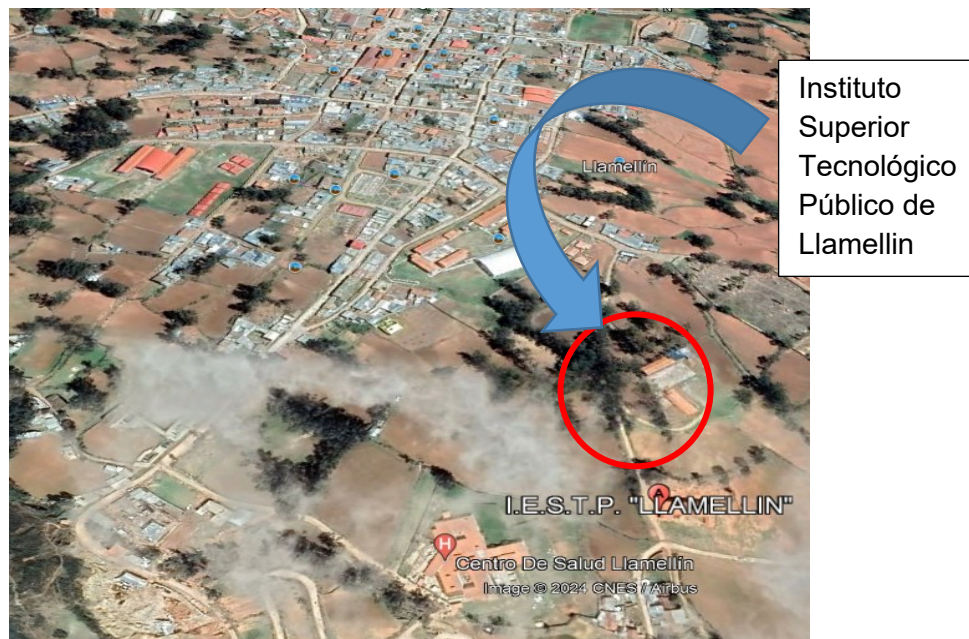
Gráfico 2: Micro localización geográfico de la Unidad Productora del Instituto Superior Tecnológico Público de Llamellín