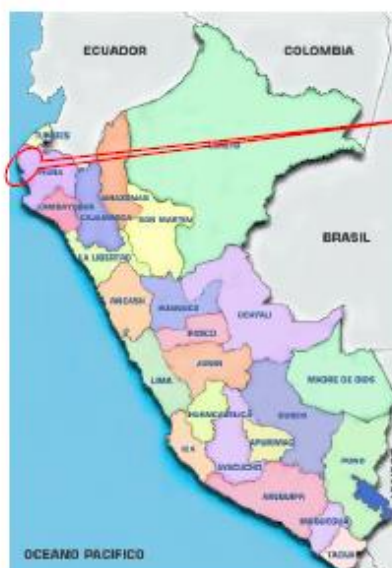
Fig. N° 01: Ubicación de las zonas del proyecto