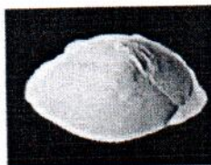
SULFATO DE ALUMINIO