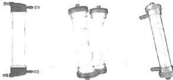
Fig.1: Dializador para Hemodiálisis de Bajo Flujo de Membrana Sintética (No implica diseño)