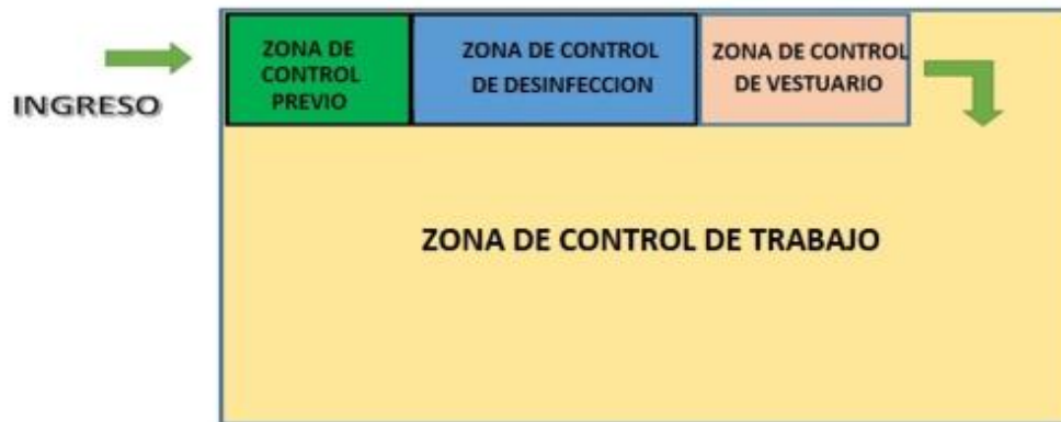
Croquis de zonas de control y prevención