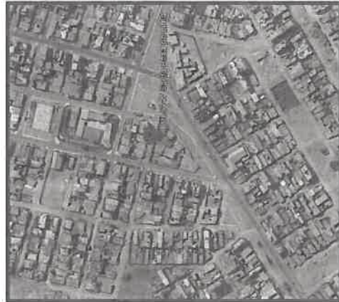
Figura N°1: Ubicación de la I.E. N°5147