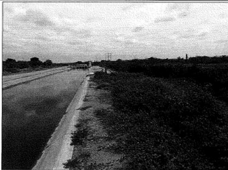
Foto N° 03: Se Observa la vegetación en la berna de servicio y/o borde del canal margen derecha del Canal Norte.