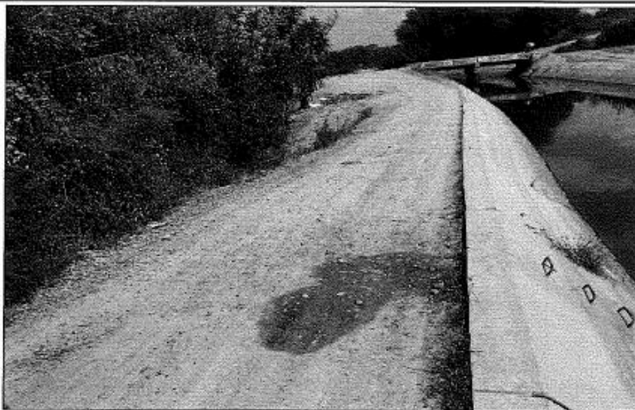
Foto N° 01: Camino de Servicio con presencia de huecos y desnivel con respecto al borde del canal.