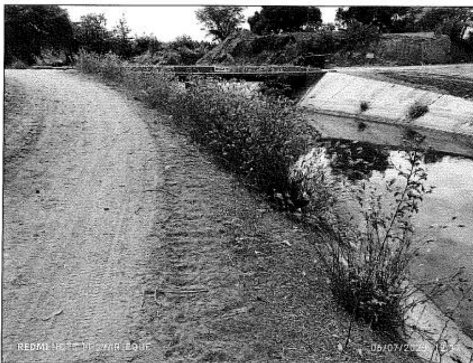
Foto N° 02: Se Observa la vegetación en la berma y/o borde del canal margen Izquierda