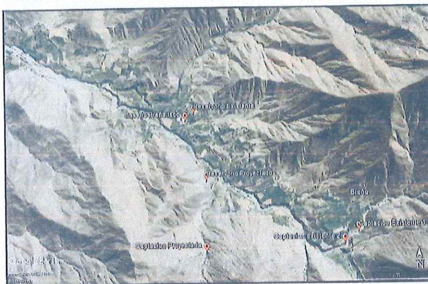
ESQUEMA DEL ÁREA DE ESTUDIO DEL PROYECTO