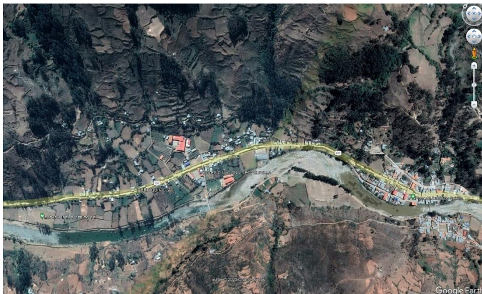
Fig. N° 02: Se observa la vista satelital de la Localidad de Aynan

Tiene una vía de comunicación terrestre con la capital de la región de Huánuco.