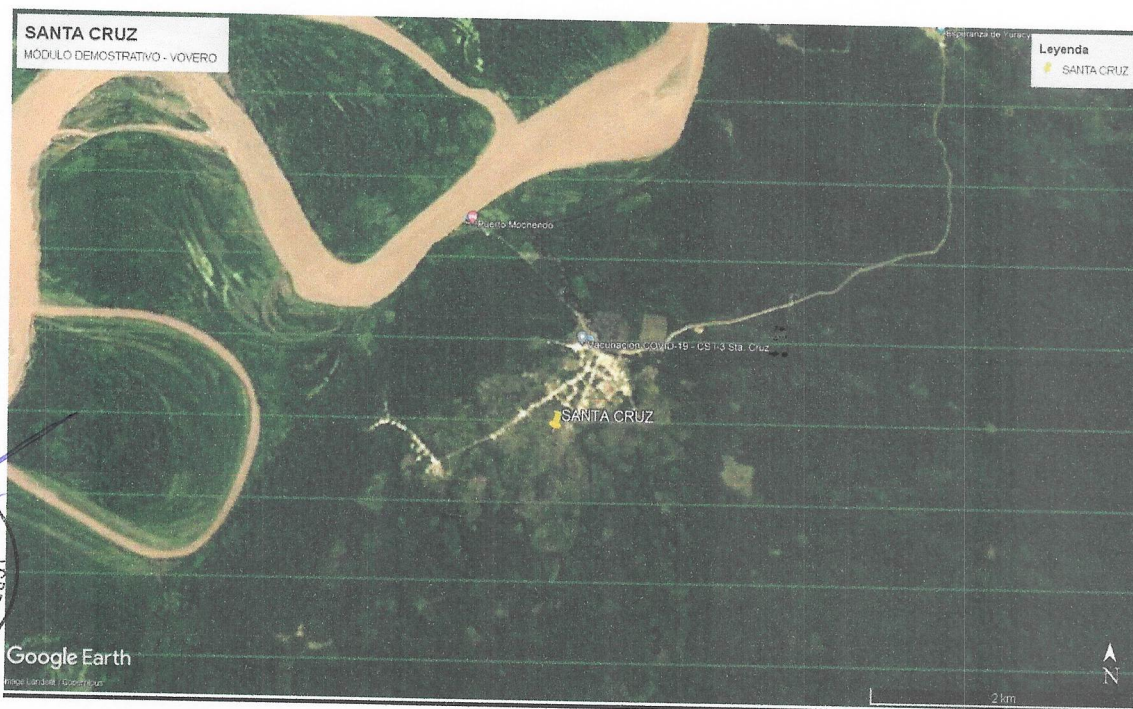
Figura 01: Ubicación de módulo de vivero – Comunidad Santa Cruz