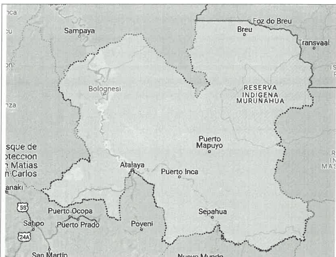
FIG. 03: Plano de Micro localización de la Ciudad de Atalaya