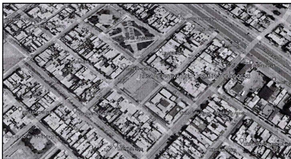
Ubicación del Predio N° 01