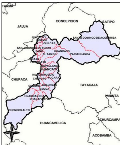
Mapa limítrofe de la provincia de Huancayo

En ese sentido se puede establecer que, La provincia de Huancayo 11 . Limita por el norte con la provincia de Concepción , por el este con la provincia de Satipo , por el sur con el departamento de Huancavelica y por el oeste con la provincia de Chupaca , por lo que, se puede establecer que no existe colindancia entre la provincia de Huancayo y la provincia de Chumbivilcas, en ese sentido, no se debe otorgar la bonificación del “diez por ciento (10%) sobre el puntaje total obtenido,” de provincia colindante al postor CENTRO CULTURAL DE EDUCACION DERECHO Y ECOLOGIA.